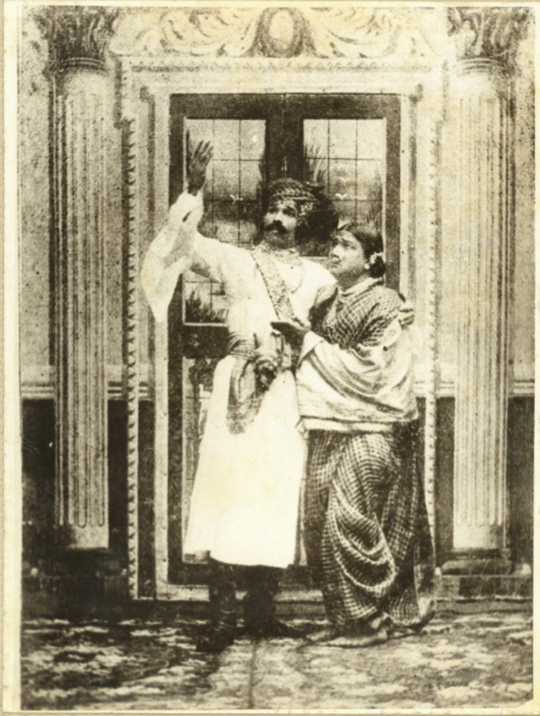
भाऊबंदकी यशवंतराव टिपणीस - माधवराव टिपणीस