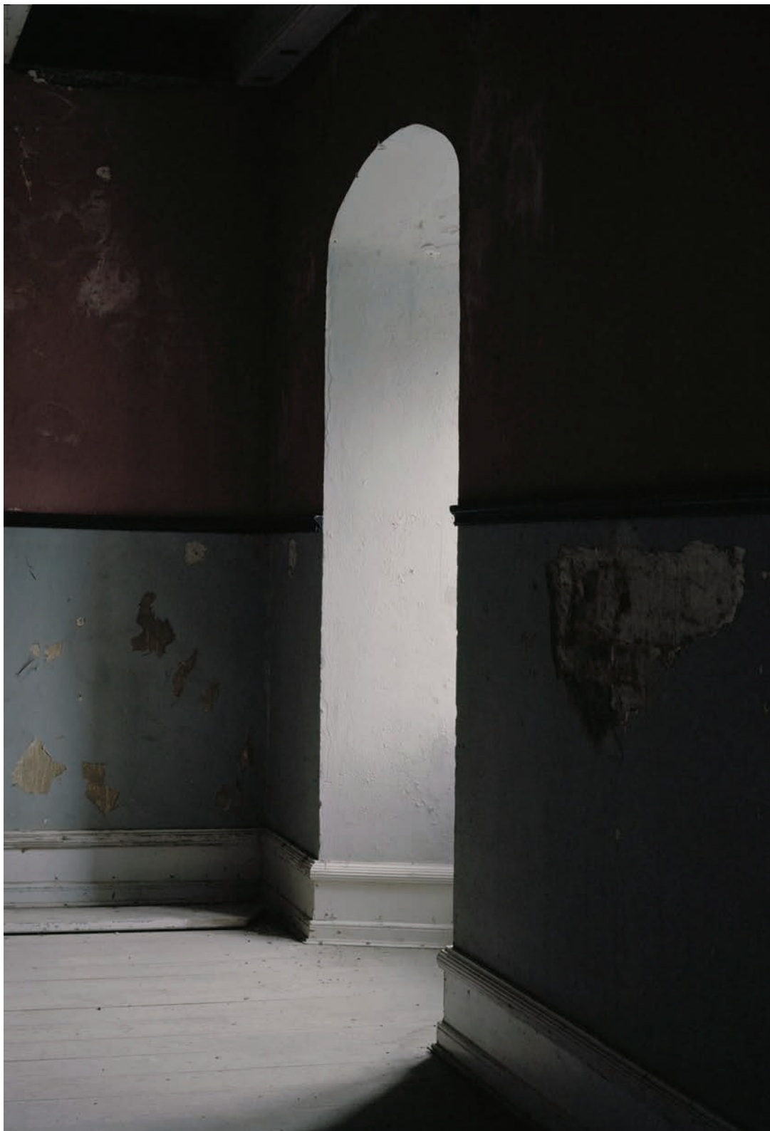
Trine Søndergaard, Interior #31 , Archival Pigment Print, 2012.