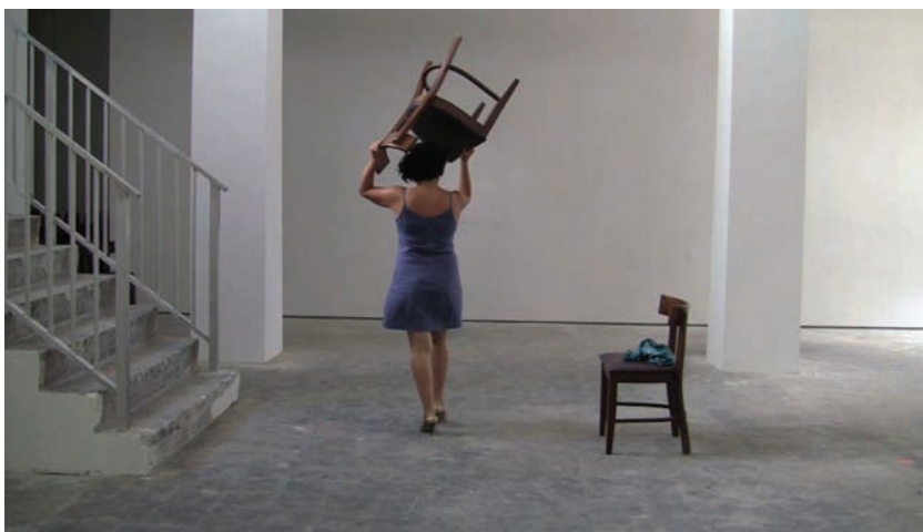
Paula Urbano, Unfolded Blindfold . Foto: Paula Urbano, 2012